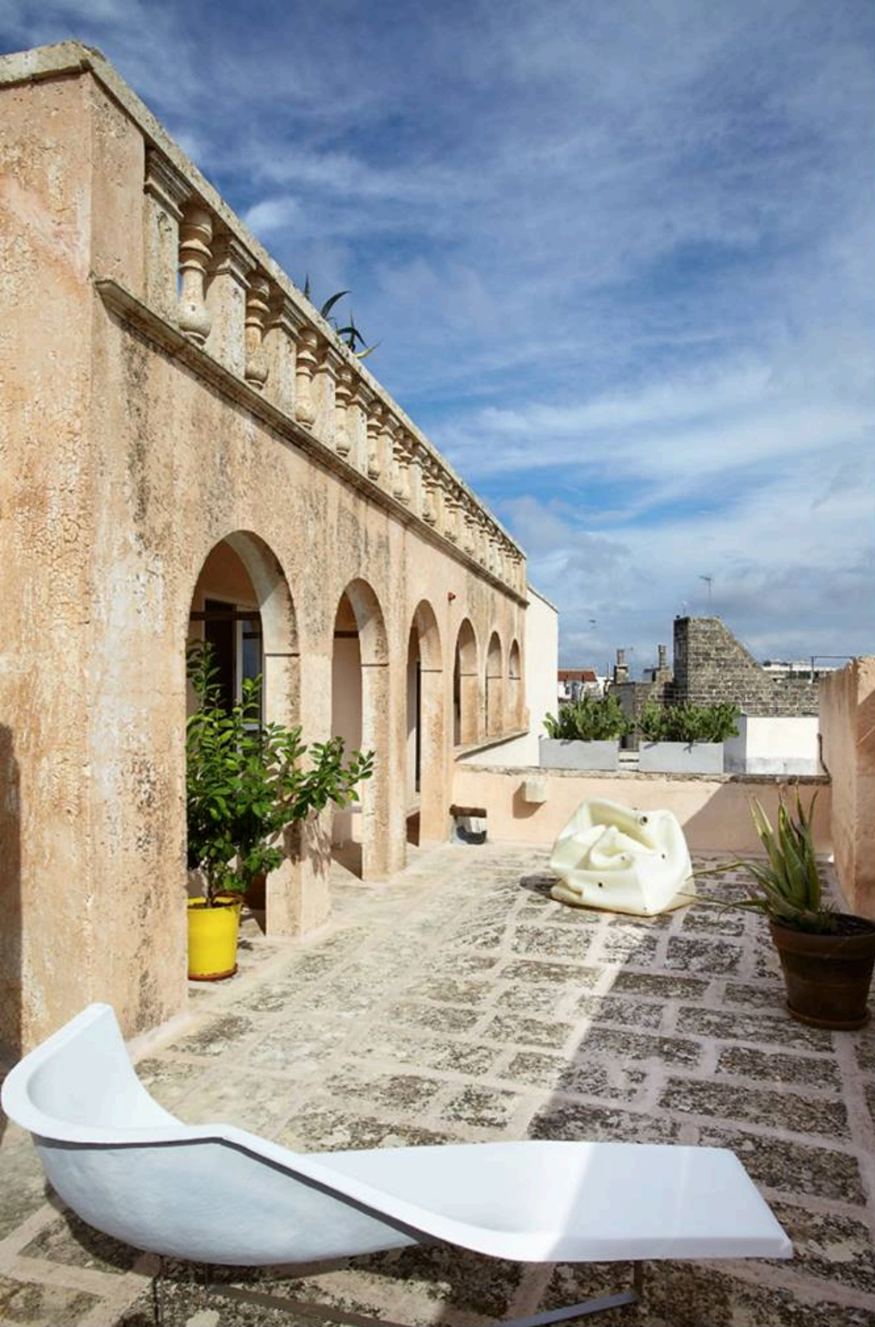
GORE LJEVO: Terasa koja se na gornjoj razini proteže oko čitavog Palazzo Mongiò dell'Elefante della Torre i s koje puca pogled na krovove Galatine prostor je okupljanja, kako oko stola za objedovanje i lounge zone, tako i u mini bazenu - jacuzziju smještenom u jednom njenom kutu. GORE U SREDINI: Najveća od četiri gostinjske sobe na prvom katu ima i salon također opremljen sjajnim primjercima talijanskog dizajna iz 1950-ih koju vlasnici toliko vole. GORE DESNO: Predvorjem prvog kata dominira skulptura A Volta , dvodijelna zidna instalacija Eduarda Habichera.